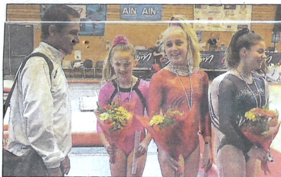
■ Les joies du podium pour les Bellegardiennes.

Loane est sur la pente montante après une arrivée cet hiver aux EVB : « 4 e au championnat de l'Ain, 2 e au régional.