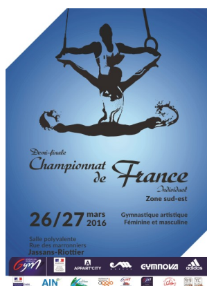
Affiche de l'édition 2016 organisée à Jassans Riottier

Le cahier des charges est lourd et le budget prévisionnel est important puisque celui-ci s'élève à 21 460€.