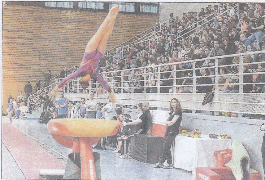
■ Le public a répondu présent tout au long du week-end.

La présidente relève juste quelques détails qui l'amusent rétrospectivement : « On ne s'en était rendu compte. Mais la date correspondait au week-end de Pâques, où c'est plus difficile de trouver des bénévoles et aussi au passage à l'heure d'été. Dimanche matin, les yeux piquaient quand même un