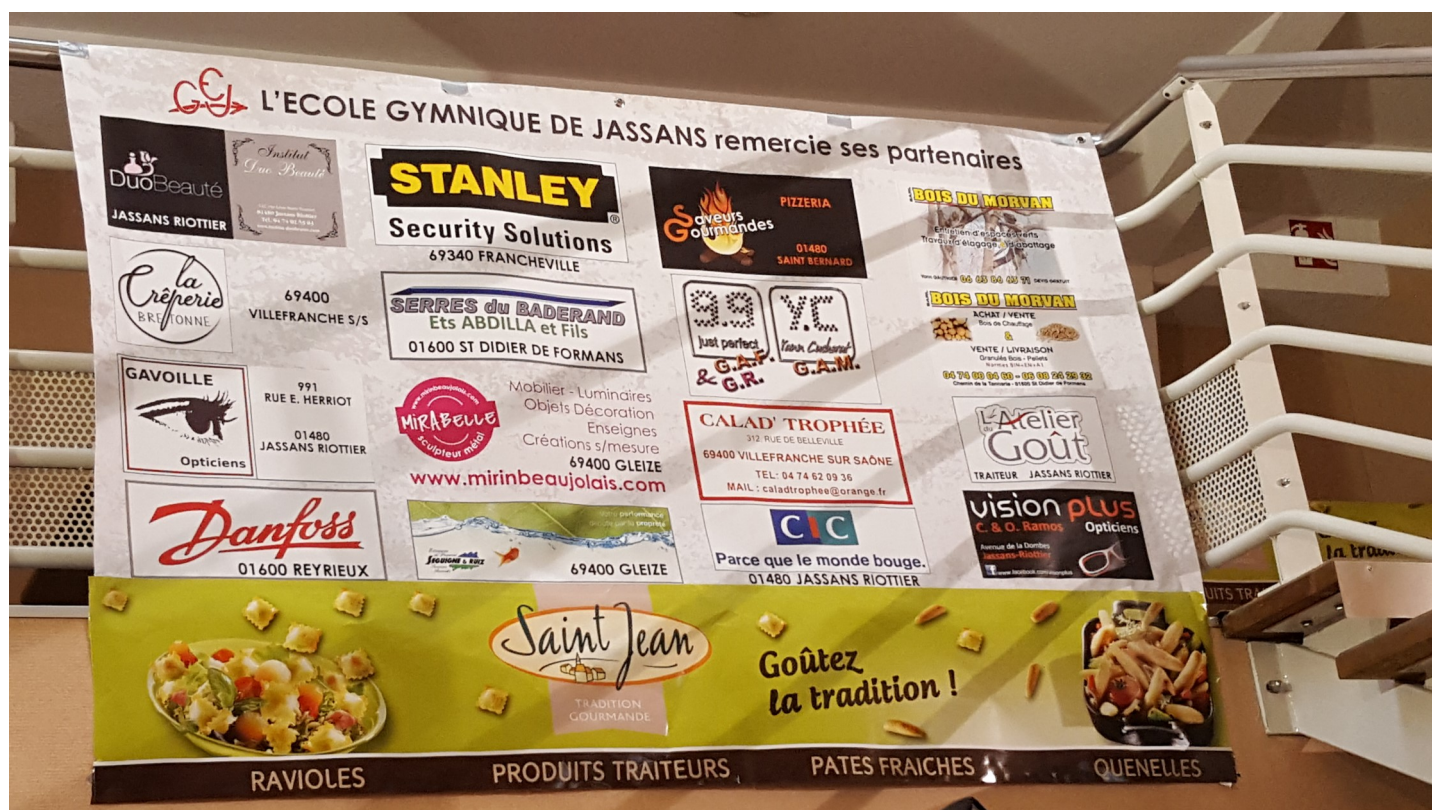
Exemple de l'affichage réalisé dans le hall d'accueil - Compétition du 26 mars 2016.

Vous pourrez ainsi acquérir une plus grande notoriété et une image valorisante associée à celle de notre club: sportive, sympathique, dynamique.